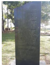
Monumento dos 100 anos da Igreja Batista