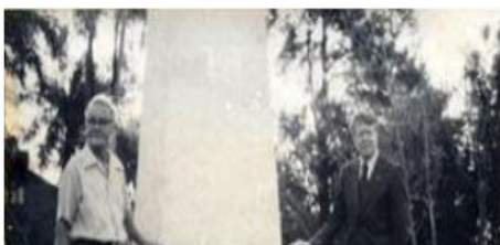
Ex-Presidente dos EUA Sr. Jimmy Carter

O Cemitério esta na orientação Leste-Oeste, pois acredita-se que quando Jesus voltar, no raiar do novo dia, as almas se levantarão e olharão para Ele.